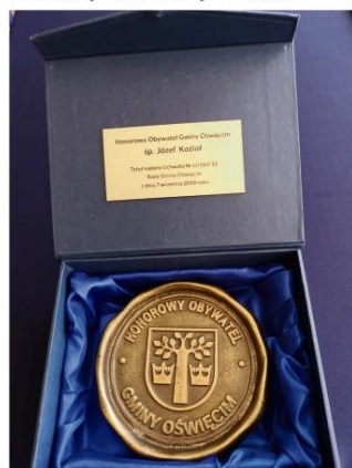
Pamiątkowy medal Honorowego Obywatela Gminy Oświęcim.

oraz autora, Michała Buska przedzielił uroczystą sesję Rady Gminy w Domu Strażaka w Brzezince.