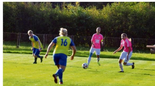
Iskierki zgodnie odprawiają kolejne rywalki i wysyłają konkurencji jasny sygnał, że w tym sezonie będą się bardzo poważnie liczyć w walce o drugoligowy awans.

Nowy trener, nowy sztyl i nowy zarząd, ale stary cel. Iskierki z Brzezinki rozpoczęły kolejny sezon w trzecioligowych rozgrywkach. Czy przyniesie on wreszcie upragniony awans?