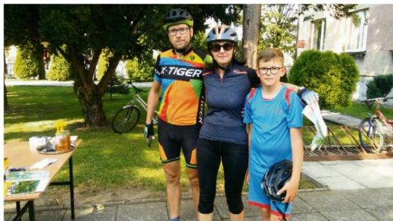
Autor internetowej relacji w Stawach Grojeckich z rodziną.

16 września około 500 osób zwiedzało naszą gminę, uczestnicząc w drugiej edycji rowerowego rajdu, tym razem pod hasłem: "Poznajemy Gminę".