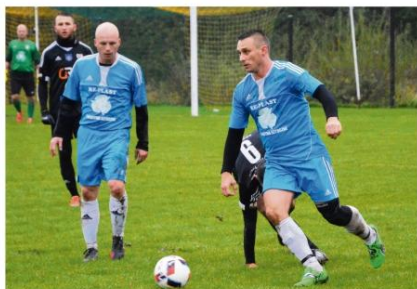
Futbolowi kibice w Rajksu mają powody do zadowolenia. Beniaminek zaliczył znakomity start i bardzo dobrze czuje się w nowym, piątoligowym towarzystwie.

W znakomitym stylu rozpoczęli historyczny, bo pierwszy sezon na piątoligowym froncie piłkarze z Rajksa. Drużyna prowadzona przez Grzegorza Bąka zajmuje drugie miejsce w tabeli okręgowki!