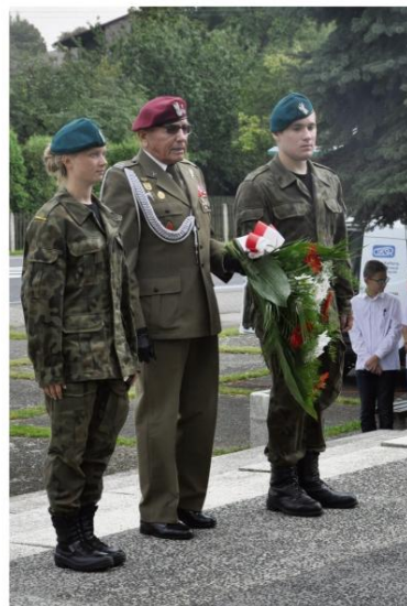
Przedstawiciel Związku Żołnierzy Wojska Polskiego i uczniowie klasy mundurowej Powiatowego Zespołu Szkół nr 2.