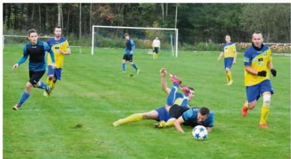
W klasie B najlepiej wystartował Sygnal Włosienica, który wygodnie rozsiadł się w fotelu lidera.

Aż trzy drużyny reprezentujące oświęcimską gminę znajdują się na czterech pierwszych miejscach po czwartej serii gier rozgrywek seniorskiej klasy B.