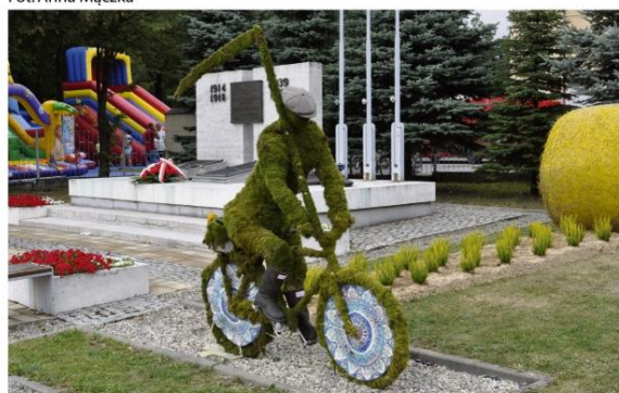
Najładniejsze dekoracje dożynkowe w Porębie Wielkiej...