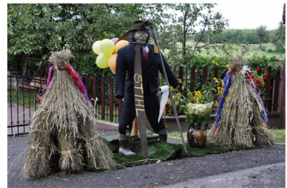
... i w Pławach.

Pierwsze miejsce zajęły ex aequo sołectwa Poręba Wielka i Plawy, drugie